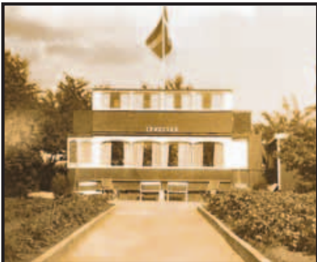
Maglevang 1934. Den nyopsatte sporvogn set fra vejen.