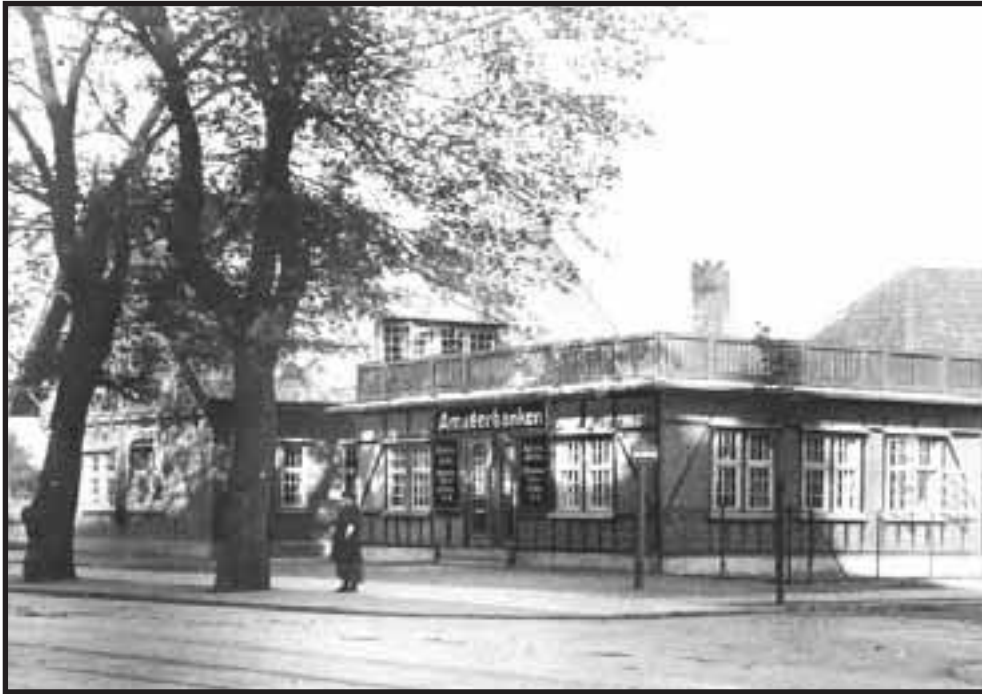
AMAGERBRO STATION OG VENTESAL CIRKA 1920.: Amagerbrogade 19 ved hjørnet af Carl Lunds Gade (nuværende Uplandsgade). Den sydlige del af ventesalen er på dette tidspunkt udlejet til Amagerbanken.

Den lille bindingsværksbygning skulle fungere som