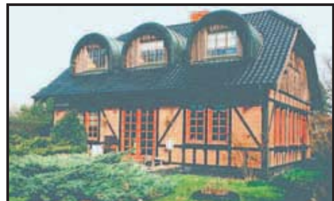
FORÅR 1995: Møllevej 79. Tidl. jernbaneventesal, bankfilial, hjemmebageri og konditori, nu moderne villa med 1. sal.