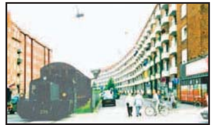
JUNI 1994: DSB bruger stadig Amagerbanens gamle spor til en smule godstrafik. »Jernbaneklubben Amagerbanen« anvendte også de gamle spor, hvor der blev arrangeret kørsel med udflugtstog.

Problemet blev klaret med midlertidige løsninger, men det er en helt anden historie, der sikkert her i jubilæumsåret bliver beskrevet i andre artikler.