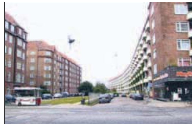
17. JULI 2002: Stien til højre for pølsevognen er nøjagtig 1.435 millimeter bred svarende til »normal-sporvidden«. Banen blev helt nedlagt i midten af halvfemserne, men det gamle stopsignal over vejbanen hænger der stadig.