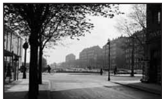
14. MAJ 1938. Amagerbanens gamle areal er ryddet og opførelsen af Københavns dengang længste bygning »Møllelængen« kan begynde. I baggrunden th. ses ejendomme i Uplandsgade. Gaden hed indtil 1936 Carl Lunds Gade. Shell-stationen tv. blev nedlagt i halvfjerdsene og afløst af et værksted.