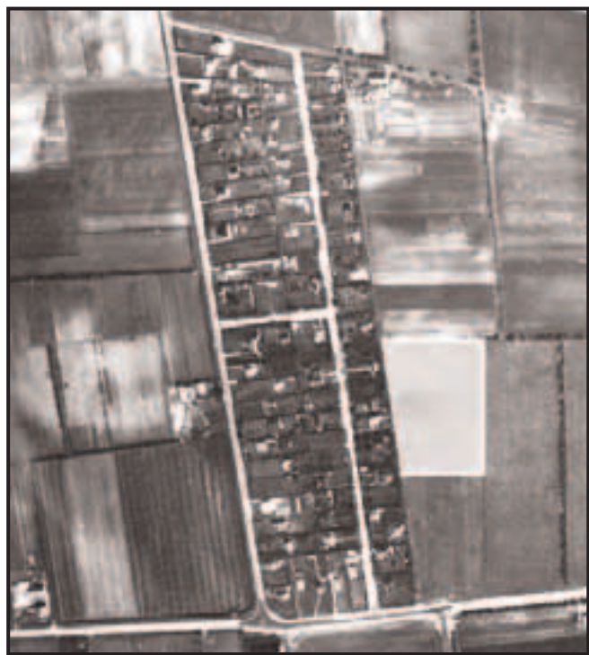
Maj 1954. Udstykningen »Maglevang« med de 4 vejstykker, Ternevænget og dele af Gåsevænget, Møllevej og Krudttårnsvej. Med gråt er angivet det markstykke Krigsministeriet fra 1916 havde lejet af gårdejereren på Kirkevej 56 (Kastaniegården).

Den 17 tons fire-akslet sporvogn, der er bygget i 1950, har Kongehuset deponeret på museet.