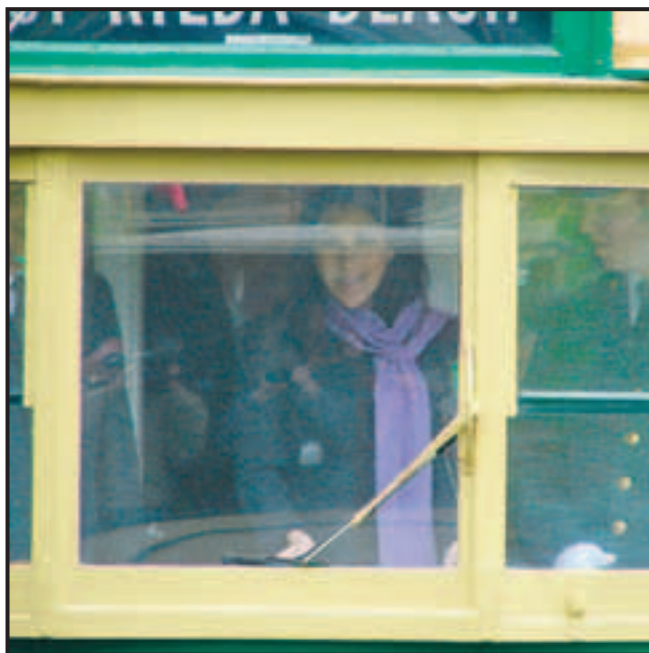
Inden Kronprins Frederik skulle være vognstyrer var det først kronprinsesse Marys tur. Ved endestationen var man »om-bord« i en Frederiksberg-motorvogn af samme type, som den, der havde stået på Ternevænget.