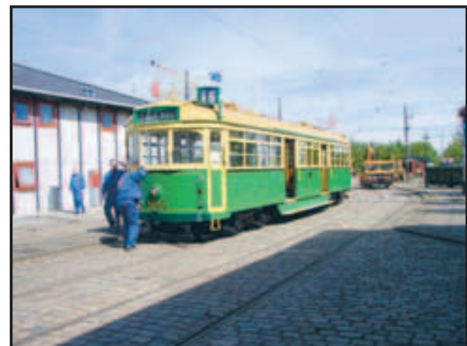
På Sporvejsmuseet på Skjoldenæsholm mellem Roskilde og Ringsted kan man se de flot restaurerede sporvogne, busser m.v. Museet har ikke kun danske vogne fra Århus, Odense og København, men man råder også over en stor samling udenlandske køretøjer. Her er Prins Christians dåbsgave fra Australien ved at blive klargjort den 23. maj 2006 til forældrenes besøg.