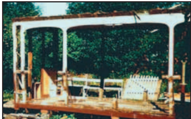
September 1966. Sporvognen fjernes, da den står på det sted, hvor den nuværende villa skal opføres.