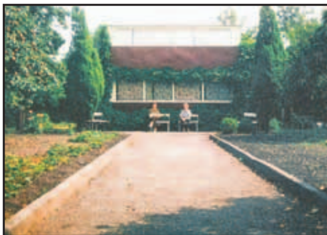
September 1966. Ternevænget 29 er lige overtaget af Lise og Bent Hagel Petersen.