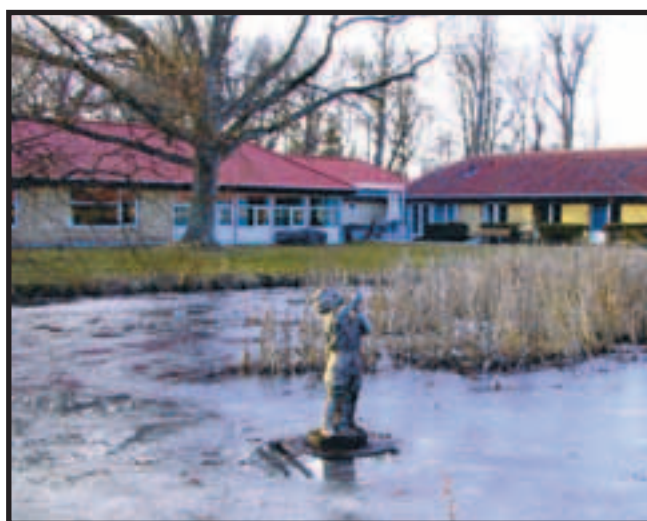
Marts 2004. Om vinteren er springvandet slukket.

Så det er rigtig, at der har stået en lille springvandsfigur samtidig flere steder i Dragør. Den første figur har nok ikke heddet »Lille Petter«, idet figurnavnet stammer fra bronze-støber Rasmussen.