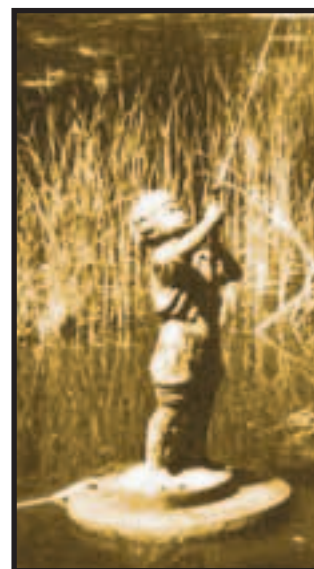
»Lille Petter« fra 1928. Først opstillet på »Nordre Væl«, så henstillet og glemt i kælderen under Stationsvej 7 og nu genbrugt i anlægget ved »Enggården«.