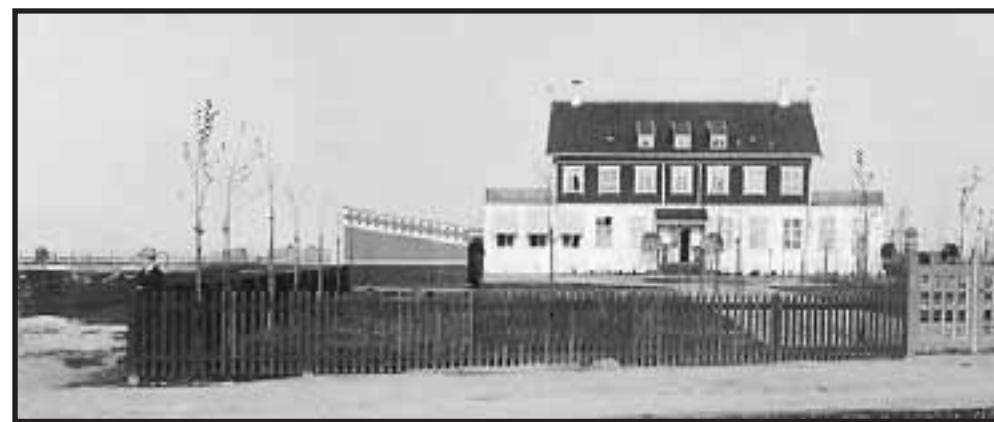
1908: Badehotellet set fra vest med indgangen på Batterivej 6. Drogdvej er ikke anlagt. Keglebanen blev senere opført til venstre for indgangen mellem stalden (træbygningen med det skrår tag) og Batterivej.

Her i jubilæumsåret kan vi glæde os over, at hotellet trods om- og tilbygninger stadig ligner det gamle Dragør Badehotel, som for 100 år siden blev opført »lige uden for byen«.